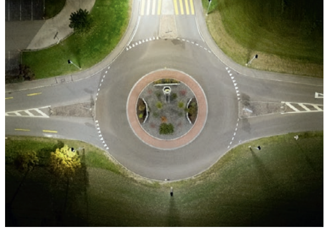
Drohnenfoto Kreisel in Bassecourt vor + nach der Sanierung