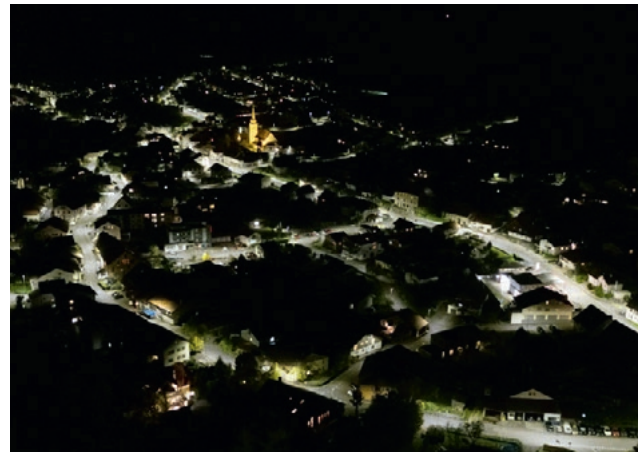
Drohnenfoto Courfaivre vor + nach der Sanierung