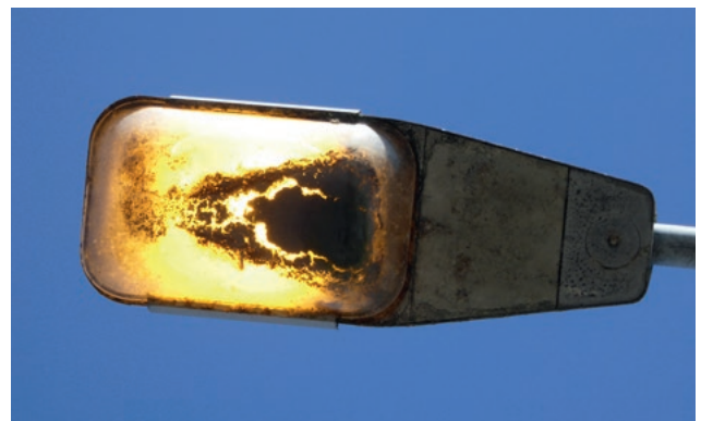
Foto verschmutzte Leuchte

2013 haben die Gemeinden Bassecourt, Courfaivre, Glovelier, Soulce, Undervelier, Sceut und Berlincourt zur drittgrössten Gemeinde im Jura mit mehr als 7000 Einwohner:innen fusioniert. Es erstaunt nicht, dass die einzelnen Gemeinden bis anhin unterschiedliche Leuchtentypen (Fabrikate und Leuchtmitteltechnologien) im Einsatz hatten. Darunter waren viele Quecksilber-, Natriumdampf- und Halogenleuchten. Die Lichtemissionen, insbesondere die Lichtstreuung, ist bei dieser Art von Leuchten hoch. Vom Licht werden zudem Insekten angezogen, welche in den Lampen verbrennen, was wiederum zu Verschmutzungen führt. Fledermäuse und andere Tiere wurden in ihrem Biorhythmus gestört.