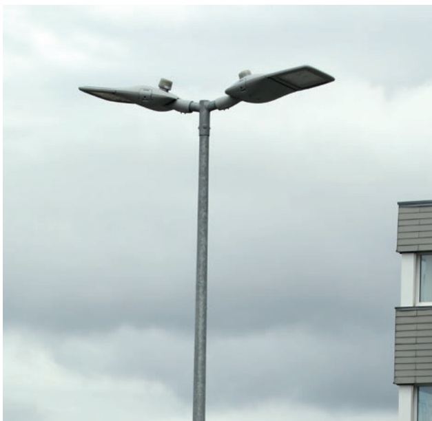
Foto Ampéra Leuchte mit Nema-Sockel

Von den Eingaben der insgesamt drei Anbieter hat die Offerte der BKW technisch und preislich am besten überzeugt. Sie erhielt den Auftrag.