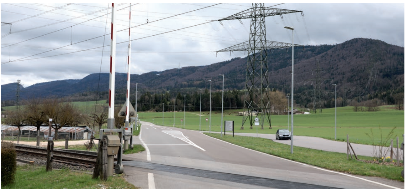
Foto Sichere Sanierung auch bei komplexen Situationen (nahe bei Eisenbahn und Hochspannungsleitungen)