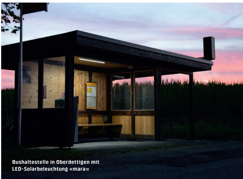
Bushaltestelle in Oberdettigen mit LED-Solarbeleuchtung «mara»

Eine ÖV-Benutzerin freut sich: «Ich fühle mich abends nun viel sicherer und auch der Postauto-Chauffeur kann einen besser sehen. Dass die Beleuchtung mit Sonnenenergie funktioniert, ist natürlich genial.